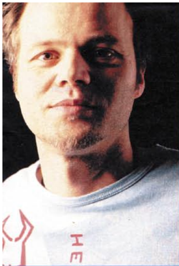
war Chef einer Internet-Agentur, dem Hamburger „Hellumcowboy-Artspace“ und die anderer Künstler